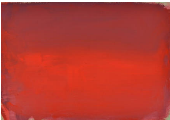
3 Bilder aus der Reihe "In der Hitze der Nacht", 2021, Mischt./MDF/Eiche, je 70x100 cm