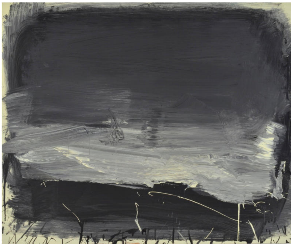
Gewitter, 2019, Mischtechnik/MDF/Eiche, 100x120 cm