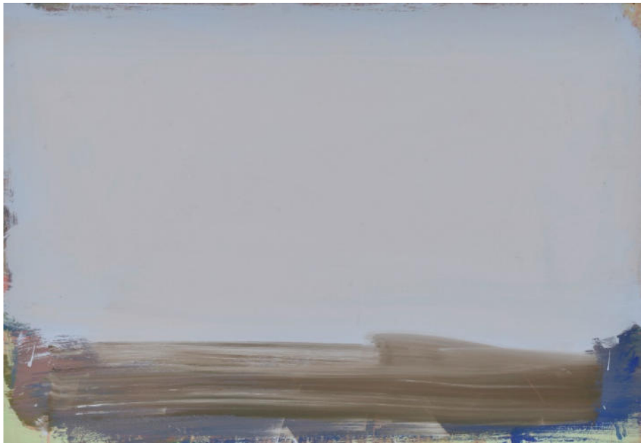
Wind am Boden, 2023, Mischtechnik/ MDF/Eiche, 70x100 cm