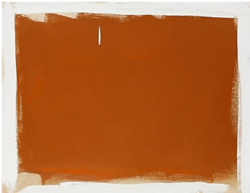
3 Elemente der Malerei (Schwerkraft, Spielfeld, Spielfeldrand), um 2014