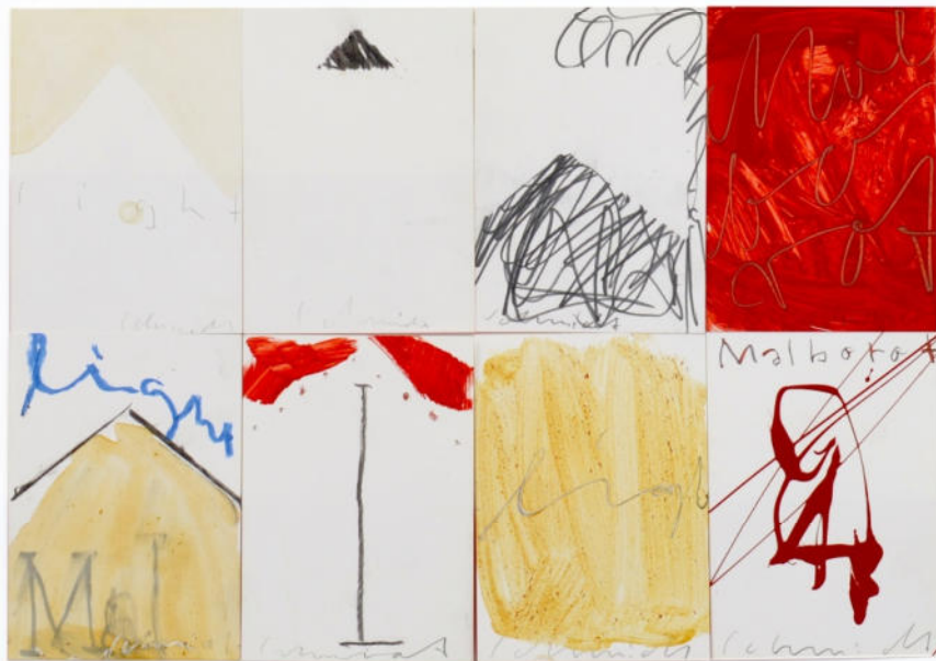
8 Postkarten aus der Reihe Malboro II, 1998, Mischtechnik/Papier, ges. 30x42 cm