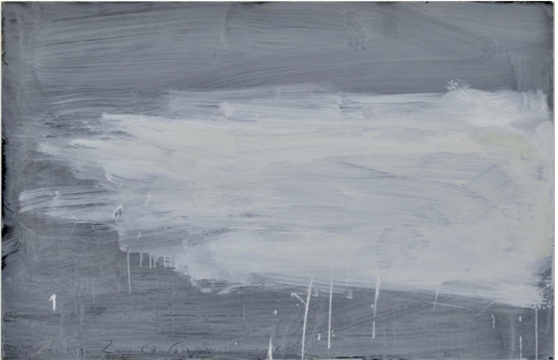
Tafelbild, 2006, Mischtechnik/Schultafellack/MDF/Eiche, 133x203 cm