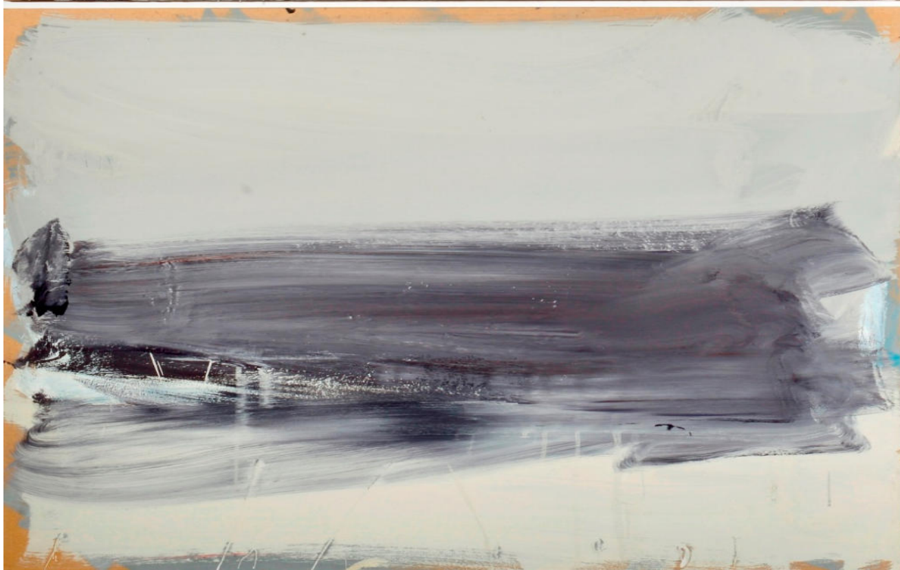
Sanfter Sturm, 2022, Mischtechnik/MDF/Eiche, vierteilig, 205x245 cm