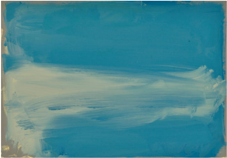
Weißer Hauch I, 2023, Mischtechnik/MDF/Eiche, 70x100 cm