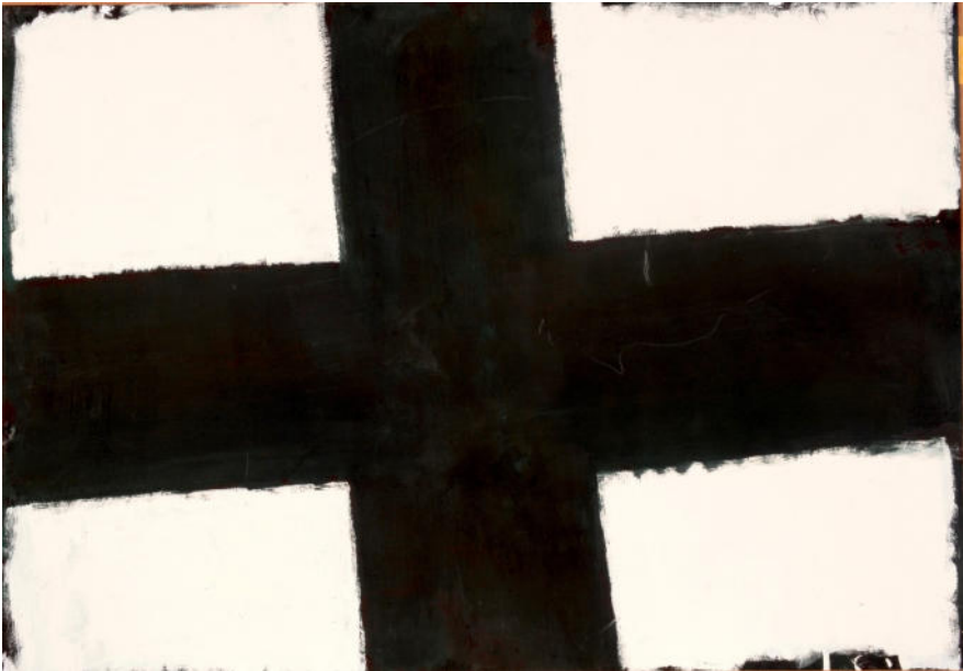
O.T. (Kreuz), 2016, Mischtechnik/Kunstdruckpapier, 70x100 cm