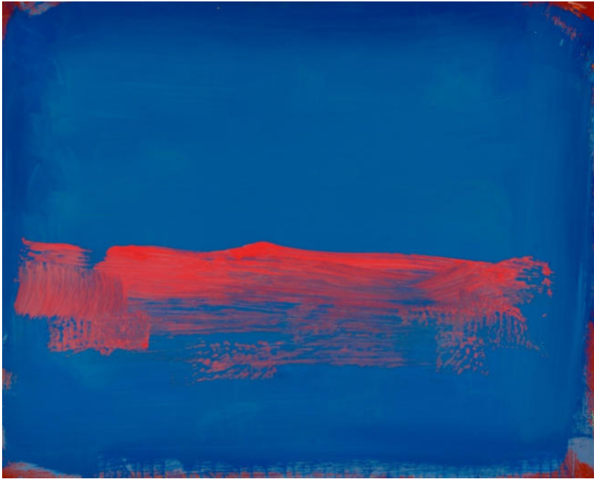
Rote Abendwolke auf Blau, 2023, Mischtechnik/MDF/Eiche, 70 x 100 cm