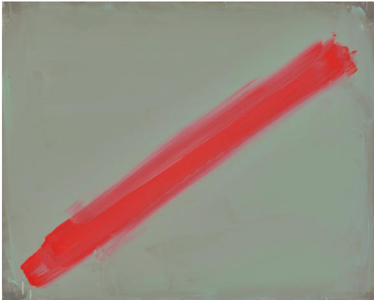
Rote Diagonale auf Grau, 2014, Mischtechnik auf MDF/Eiche, 80x100 cm