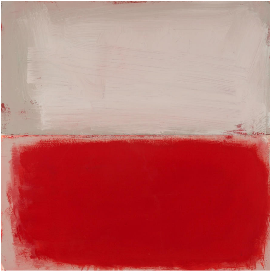
Erdbeershake, 2021, Mischtechnik/MDF/Eiche, zweiteilig, ges. 121x121 cm