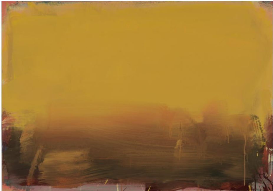
Gelblich, 2023, Mischtechnik/MDF/Eiche, 70x100 cm