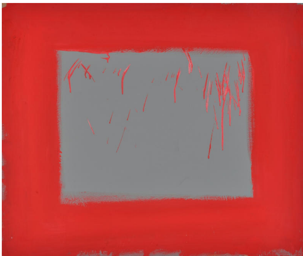
Rotes Fenster (aus der Reihe: Blind Faith), 2016, Mischt./MDF/Eiche, 100x120 cm