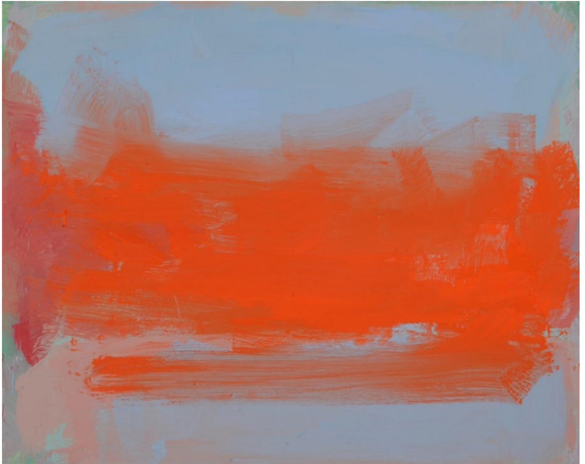
Orange auf Blau (Reihe Diaphan/Adiaphan), 2023, Mischt./MDF/Eiche, 130x160 cm