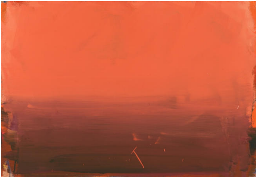
Rötlich, 2023, Mischtechnik auf MDF/Eiche, 70x100 cm