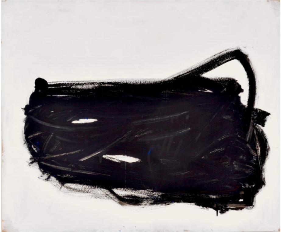
Schwarzes Bündel (aus der Reihe: Blind Faith), 2016, Misch./MDF/Eiche, 100x120 cm