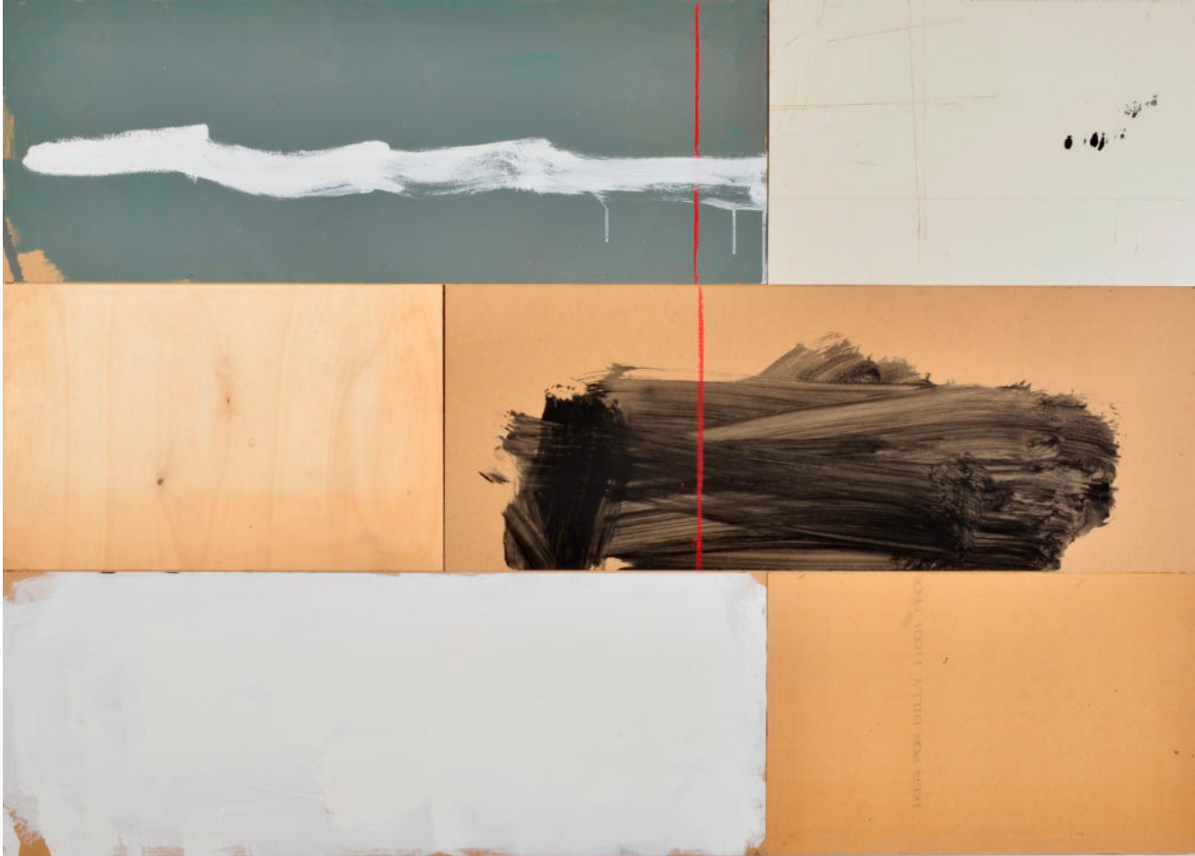
Elementar, 2019, Accrochage verschiedener Holzplatten, Mischfarben, 135x192 cm