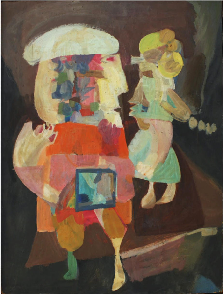
O:T., 1956, Eitempera/Hartfaserplatte, 75x57 cm, signiert