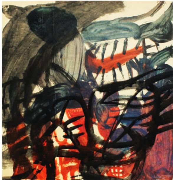
O.T., 1960, Eitempera/Papier, 44,5x45 cm, signiert