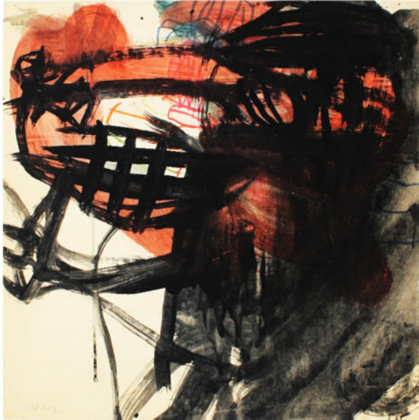
O.T., 1960, Mischtechnik/Papier, 44,5x45 cm, signiert