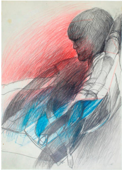
O.T., um 2000, Bleistift/Buntstift/Papier, 29,5x20,5 cm