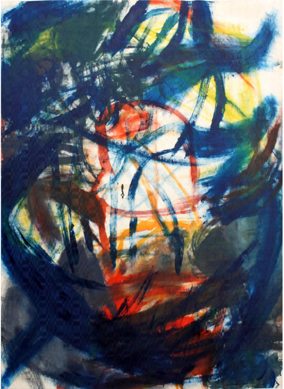
O.T., Papiertischtuch/Stoff/Sperrholz, 114x82 cm