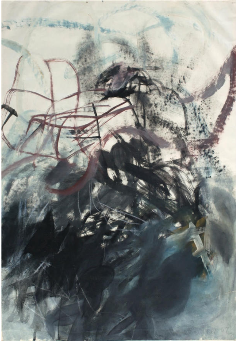
O.T., 1962, Eitempera/Papier, 61x43 cm, signiert