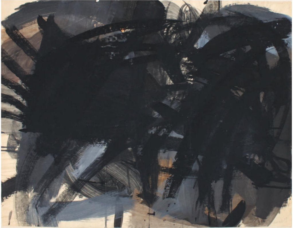
O.T., 1959, Eitempera/Papier, 63x80 cm, signiert