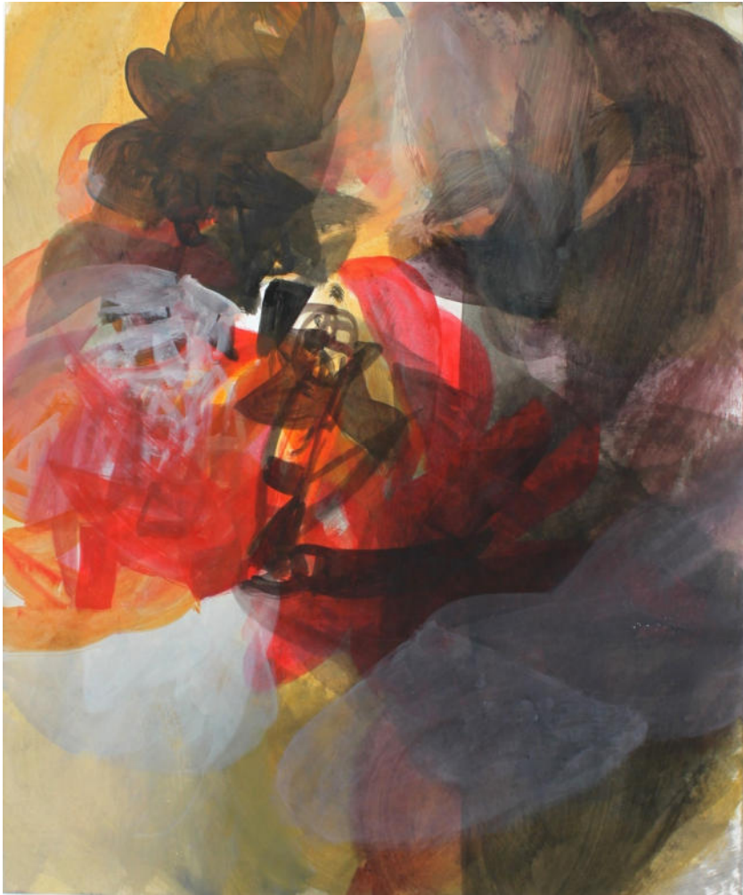
O.T., 1990er Jahre, Aquatec/Papier, 44x36 cm