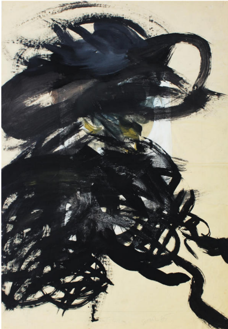
Plakat übermalt „Kleine Galerie Schwenningen“, 1965, Eitempera/Papier, 60,5x42,5 cm, signiert