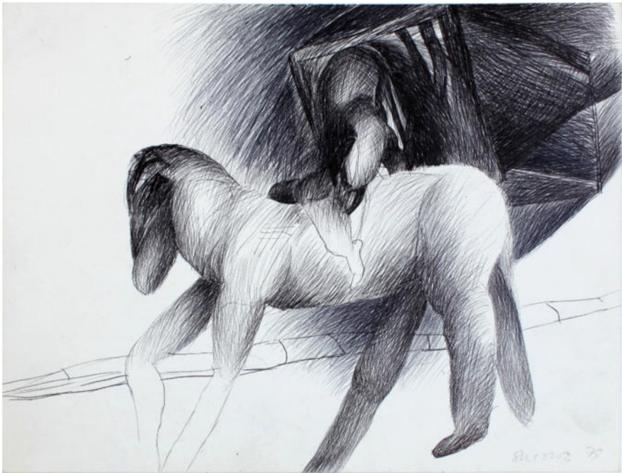
O.T., 1978, Bleistift/Papier, 20,5x27,5, signiert