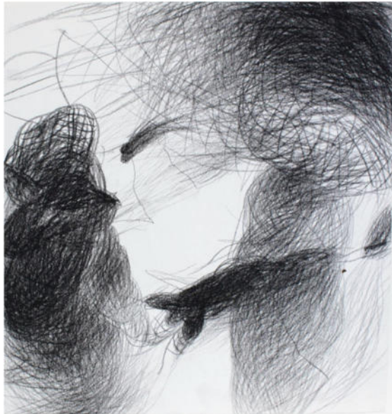
O.T., um 2000, Ölkreide/Papier, 44x40,5 cm