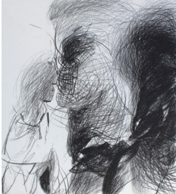
O.T., um 2000, Ölkreide/Papier, 44x40 cm