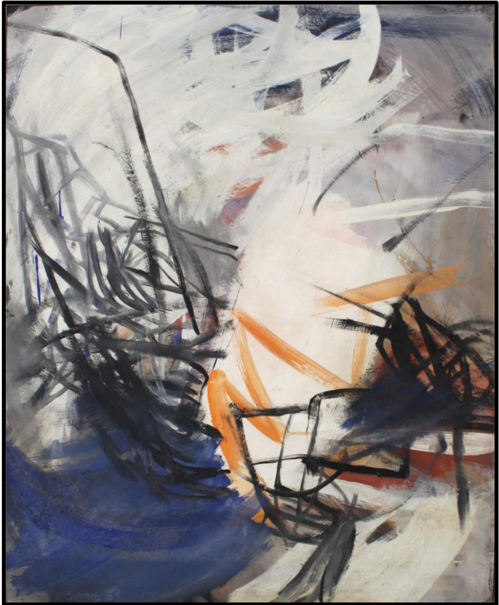
O.T., 1961, Eitempera/Hartfaser, 82x102 cm (rückseitig bemalt)