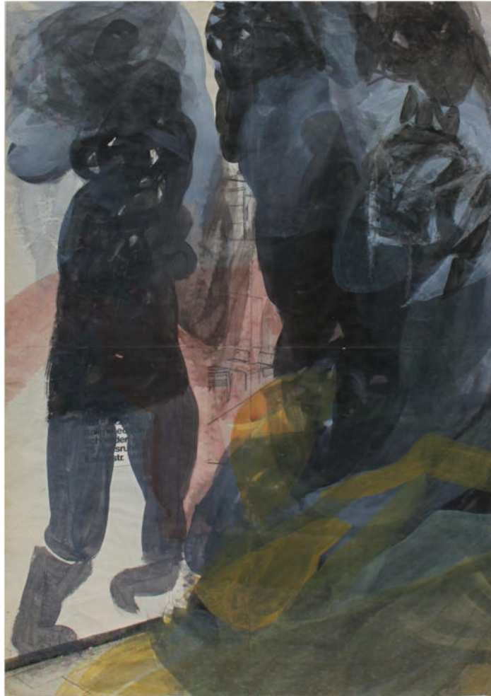
O.T., 1980/90er Jahre, Aquatec/Karton, 61x43 cm