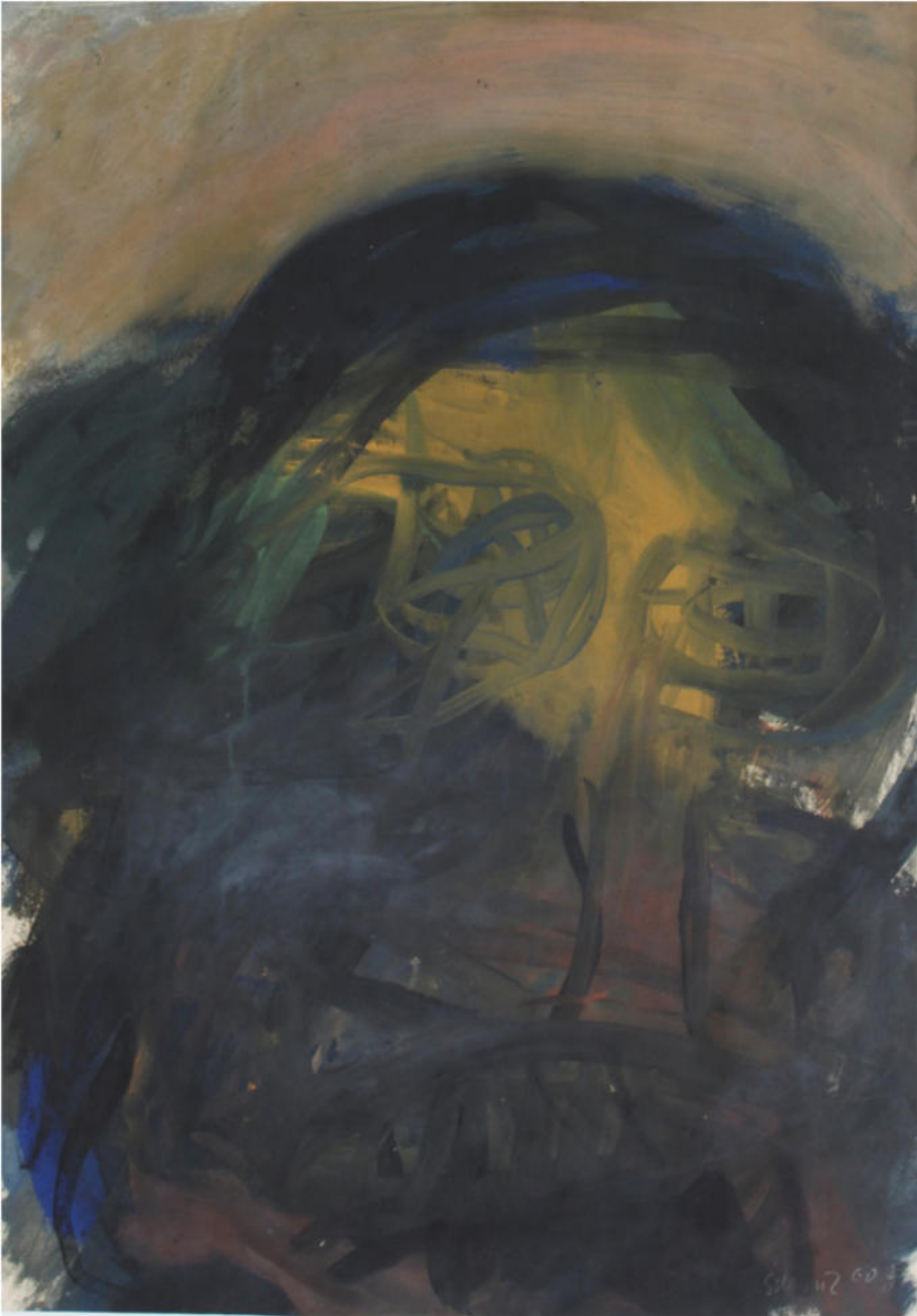
O.T., 1961, Eitempera/Papier, 61x43 cm