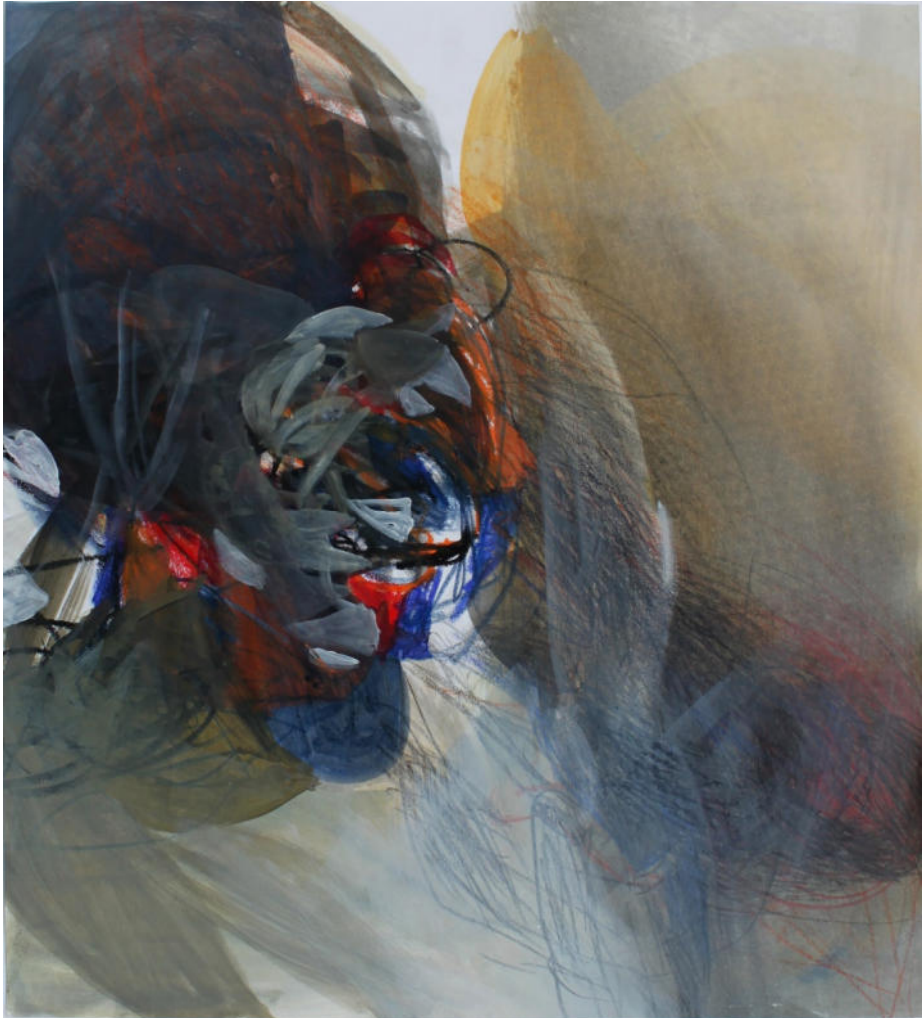
O.T., 1990er Jahre, Mischtechnik/Papier, 44x40 cm