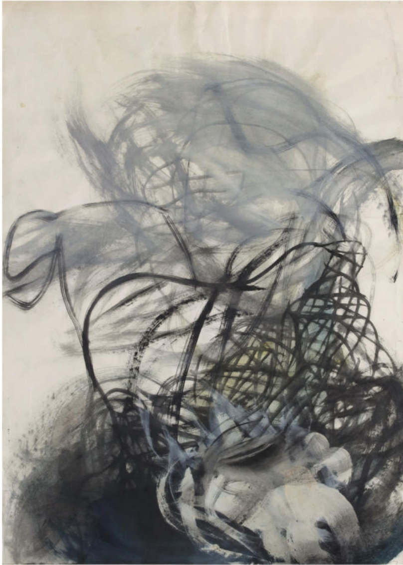
O.T., 1980 Jahre, Eitempera/Papier, 61x43 cm