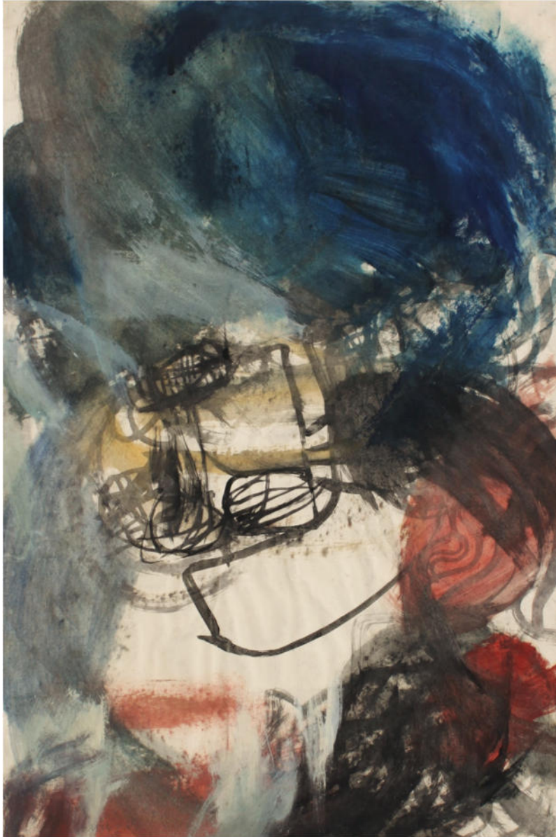
O.T., 1961, Eitempera/Papier, 78x52 cm