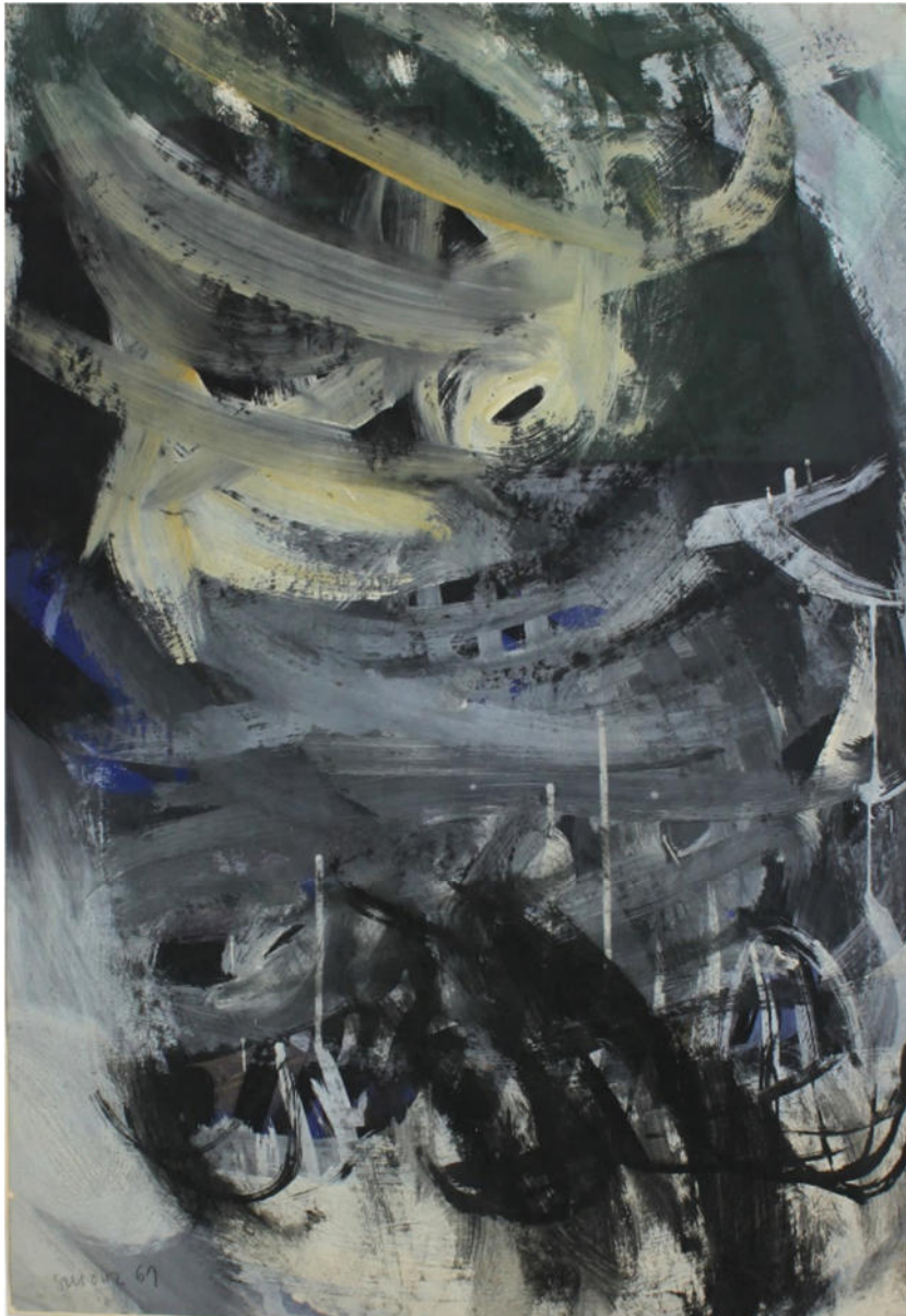
O.T., 1961, Eitempera/Papier, 58x40 cm, signiert