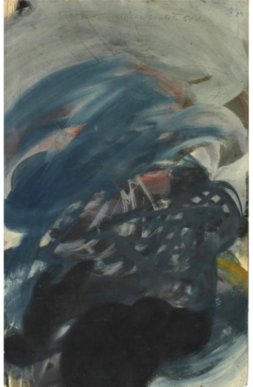
O.T., 1959, Eitempera/Karton, 38x26 cm, beidseitig bemalt, signiert