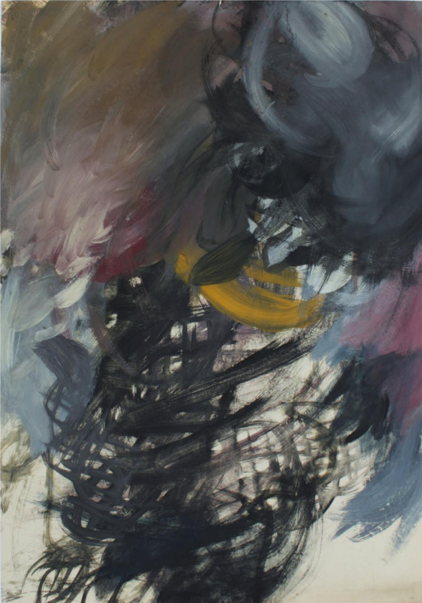
O.T., 1960, Eitempera/Papier, 59x42 cm, signiert