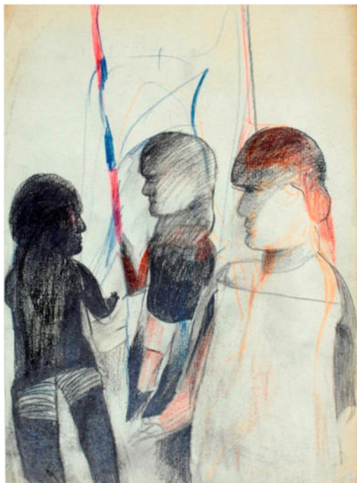
O.T., 1990er Jahre, Bleistift/Buntstift/Papier, 30x22,5 cm, signiert