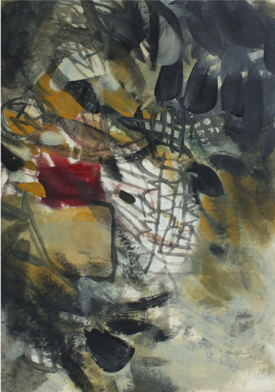
O.T., 1961, Eitempera/Papier, 61x43 cm, signiert