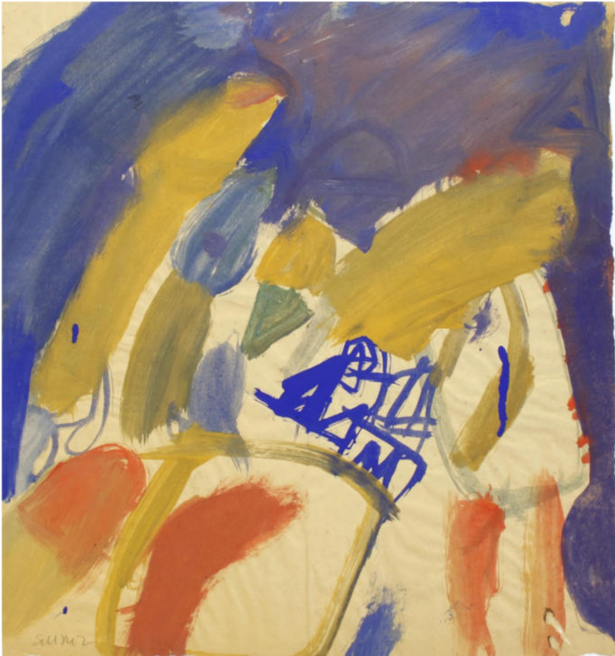
O.T., 1960, Eitempera/Papier, 37x35,5 cm, signiert