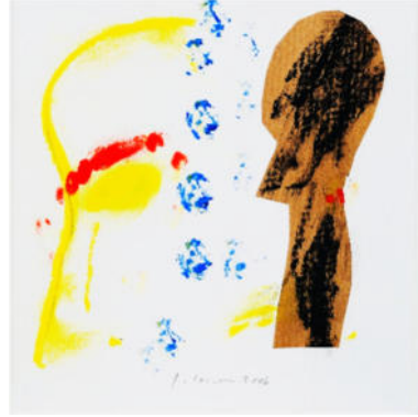
„Atelierreliquie“, 2006, Mischt./Collage, 19x19 cm