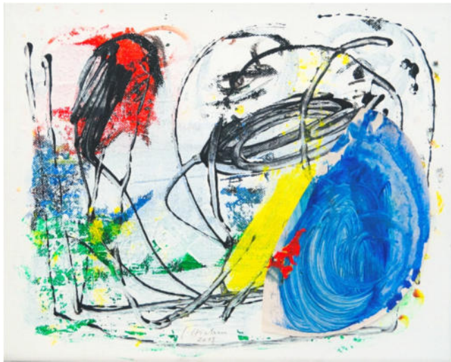
„Rot Blau Grün“, 2013, Acryl/Leinwand, 70x50 cm