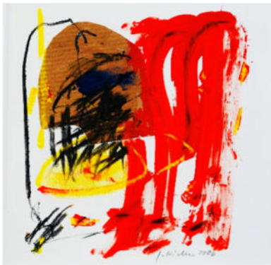
„Atelierreliquie“, 2006, Mischt./Collage, 19x19 cm