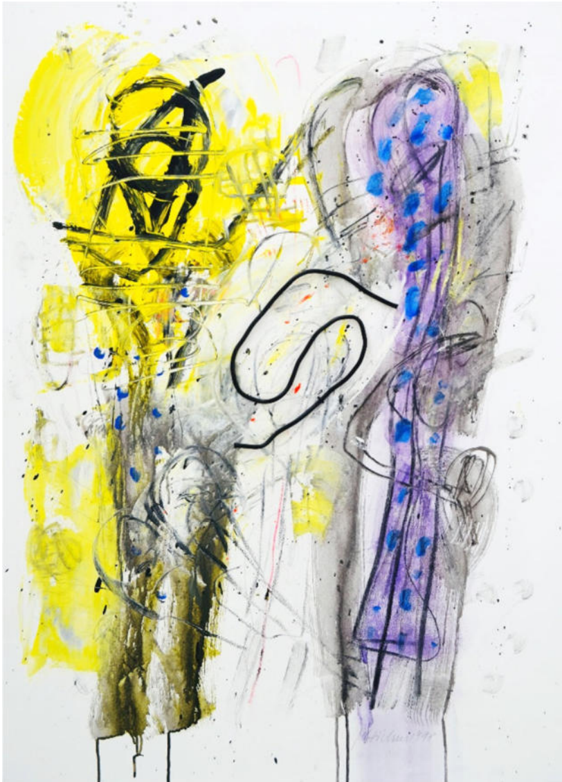
„Kontaktieren, 1998, Acryl/Leinwand, 110x80 cm