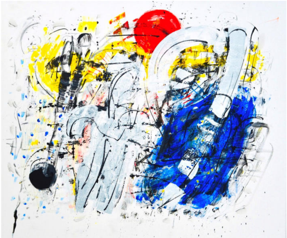
„Koronis, Planet und blauer Torso“, 2007, Acryl/Leinwand, .100x120 cm