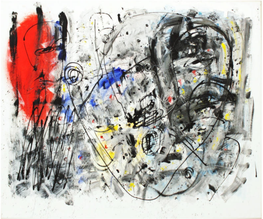
„Versuchung I“, 2011/12, Acryl/Leinwand, 100x120 cm