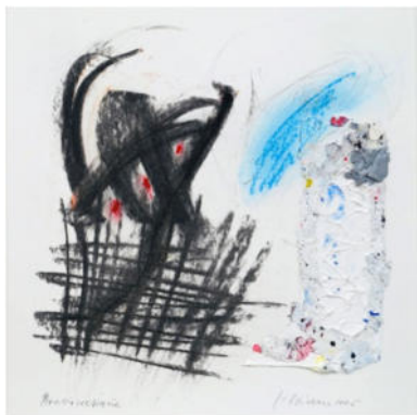
„Atelierreliquie“, 2006, Mischt./Collage, 19x19 cm