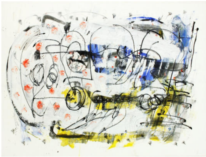
„Botschaft“, 2005, Acryl/Leinwand, 60x80 cm