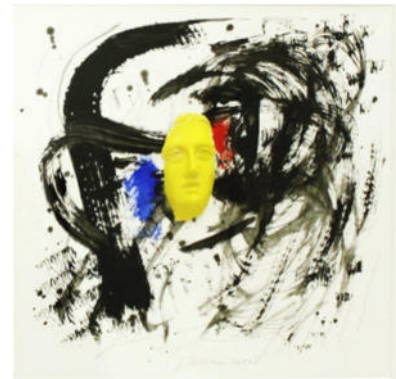
„gelber Kopf vor Schwarz“, 2021 Acryl/Gips, 24x24 cm