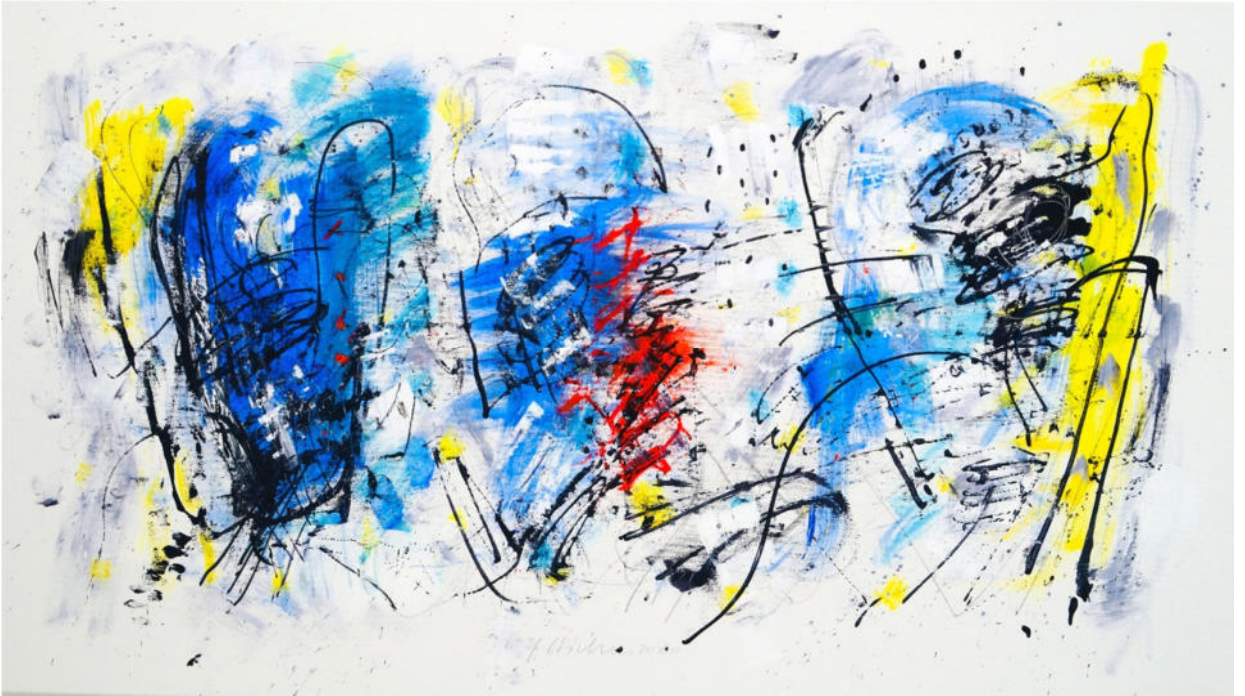
„Torsi“, 2020, Acryl/Leinwand, 90x160 cm