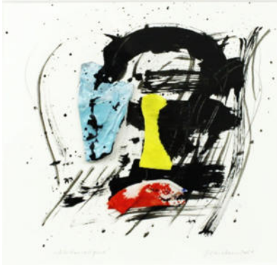
„Atelierreliquie“, 2021, Acryl/Collage, 24x24 cm