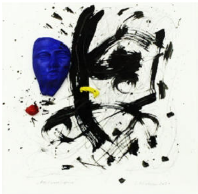
„Atelierreliquie mi blauem Kopf vor Schwarz“, 2021, Acryl/Gips, 24x24 cm