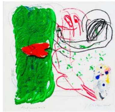
„Atelierreliquie“, 2006, Mischt./Collage, 19x19 cm