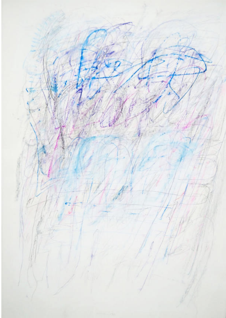
„O.F. hellblau“, 1981, Bleistift/Farbstift, 100x70 cm