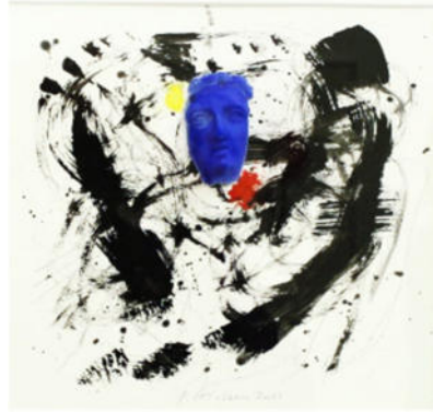
„Blauer Kopf vor Schwarz 2“, 2021 Acryl/Gips, 24x24 cm