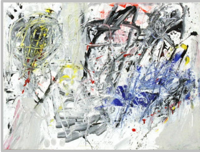
„endlos gestisch 1“, 1993, Acryl/Leinwand/Spanplatte, 32,5x42,5 cm