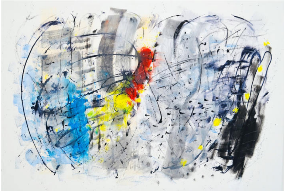
„come together“, 2019/20, Acryl/Leinwand. 99x130 cm