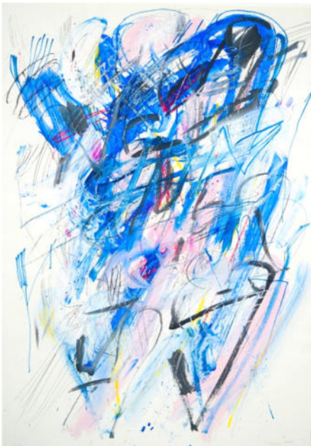
„O.F. blau-rosa“, 1983, Gouache, 100x70 cm