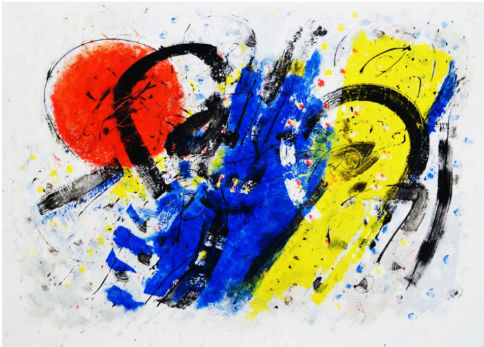
„Paar mit Rot Blau Gelb“, 2013, Acryl/Leinwand, .120x160 cm