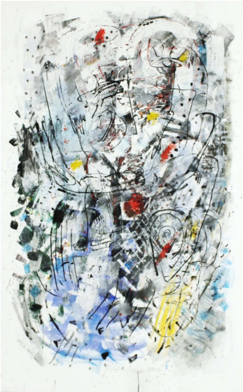
„Nach dem Spiel“, 2014, Acryl/Leinwand, 160x100 cm