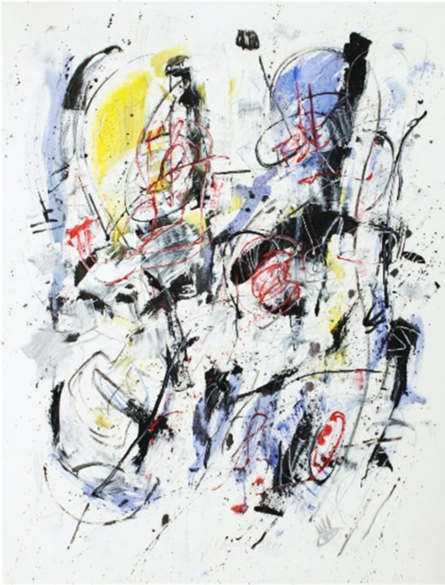
„Unverwechselbar“, 1999, Acryl/Leinwand, .130x100 cm