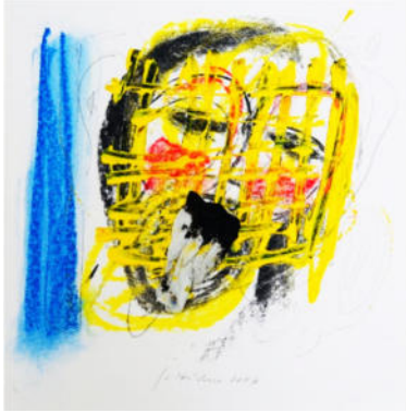
„Atelierreliquie“, 2006, Mischt./Collage, 19x19 cm