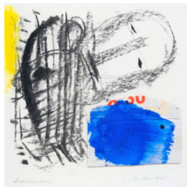
„Atelierreliquie“, 2006, Mischt./Collage, 19x19 cm