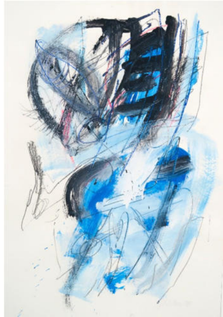
„O.F. blau-weiß“, 1988, Gouache, 100x70 cm