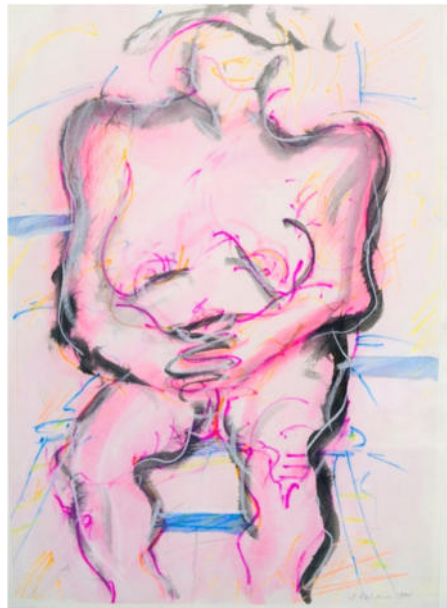
„Camela (blau)“, 1975, Gouache/Bleistift, 34,5x25 cm „Camela (rosa)“, 1975, Gouache/Bleistift, 34,5x25 cm