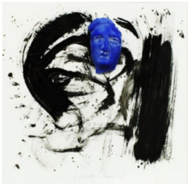
„blauer Kopf vor Schwarz 1“, 2021 Acryl/Gips, 24x24 cm