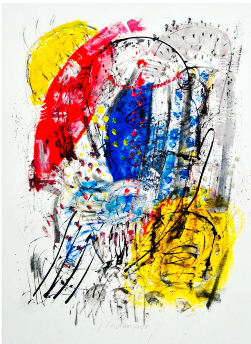
„gelb rot blau – Kopf in Bewegung“, 2008, Acryl/Leinwand, .120x90 cm