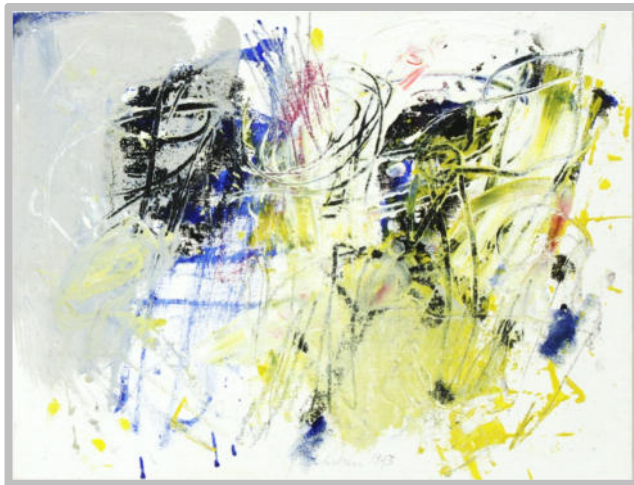
„endlos gestisch 2“, 1993, Acryl/Leinwand/Spanplatte, 32,5x42,5 cm