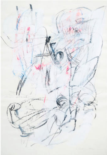
„O.F. rosa-blau“, 1990, Gouache, 100x70 cm