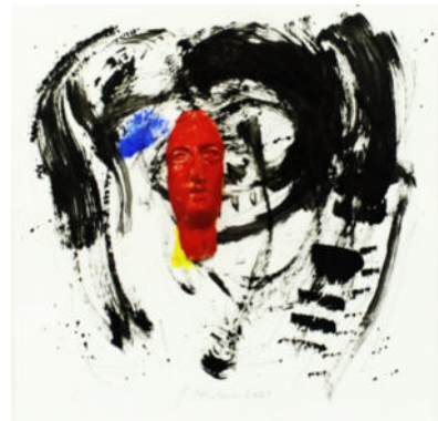
„roter Kopf vor Schwarz 1“, 2021 Acryl/Gips, 24x24 cm