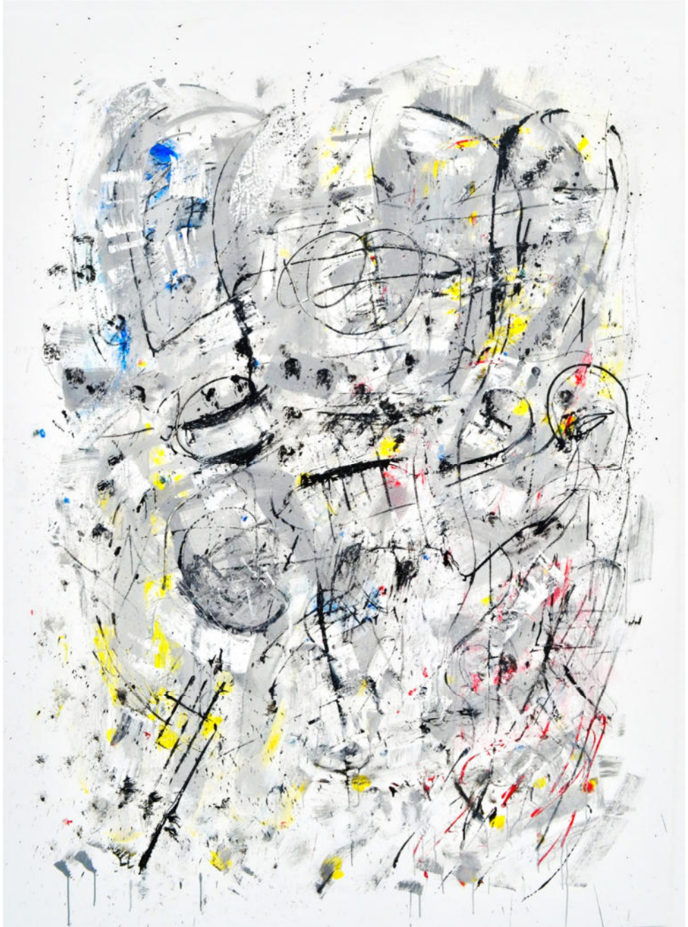
„Paar mit Grau II“, 2019, Acryl/Leinwand, 230x170 cm